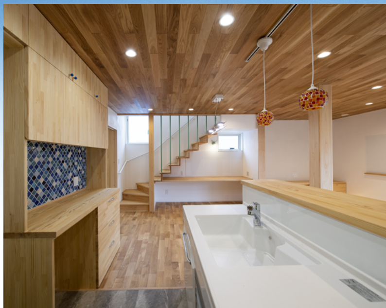
地域型住宅グリーン化事業「信州の優良住宅を創るなかま」グループ補助金利用